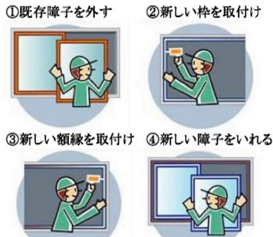
①既存障子を外す ②新しい枠を取付け ③新しい額縁を取付け ④新しい障子をいれる

窓のリフォームをしたいけど、長期間の工事や騒音は困る…。カバー工法なら枠部分が厚くなり、ガラス部分が数センチずつ狭くなってしまいますが、壁を壊すなど工事が大きくなり、騒音もありません。断熱・防音効果のある窓が最短半日で取り付けられます。