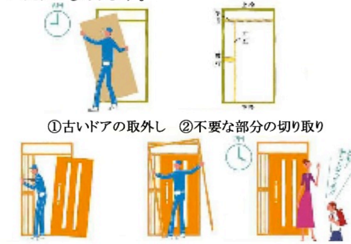
①古いドアの取外し ②不要部分の切り取り ③新しい枠の取付け ④外と内に額縁を取付け ⑤工事完了

玄関ドアのリフォームで何日もかかるのは夜が少し心配…。カバー工法は既存の枠の上に新しいドアを枠ごと取り付けます。そのためたった一日で完成させることができます。光を取り込むためのガラス部分のあるドアや、風を取り込む採風窓のついたドアもあります。