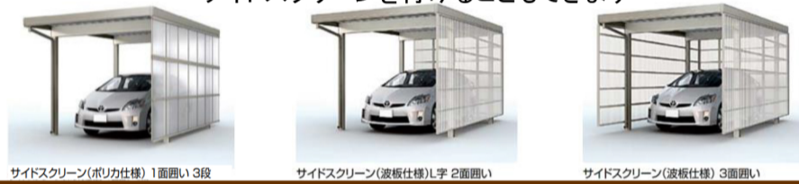
サイドスクリーン(ポリカ仕様) 1面囲い 3段